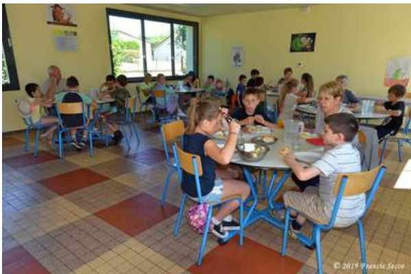
Les seniors à la cantine, un échange intergénérationnel très bénéfique !

Ce projet, vite adopté par la grande majorité du conseil, est une continuité de l'OPÉRATION DES SENIORS A LA CANTINE proposée depuis début 2018.