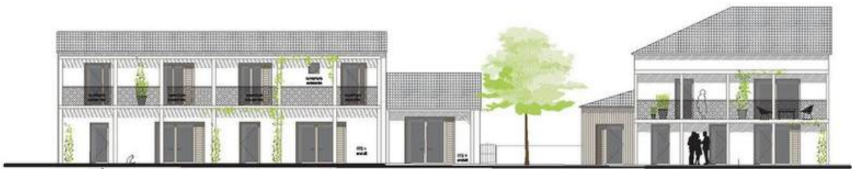
Façade sud, depuis le jardin